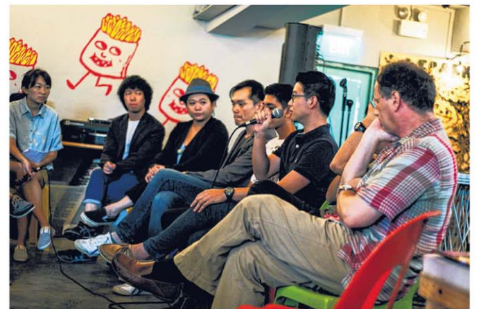
音乐制作人在讨论会上与热爱电子音乐的学生分享经验。