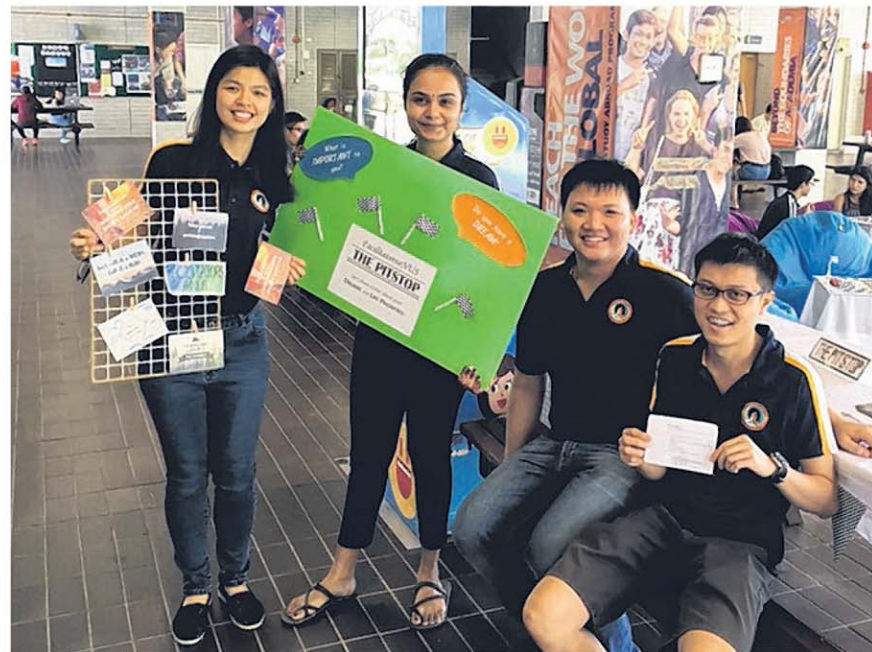
国大推动者学生小组在校园内举办“The Pitstop”活动，让学生停下脚步，反思自己的人生目标和梦想。

小组也举办内部培训，帮助成员提升自己，学习和练习推动活动的知识和技巧。新成员都必须参加学生推动者基本训练 (Basic Student Facilitators Training)，从中学到基本的推动技能和如何有效地传达游戏的