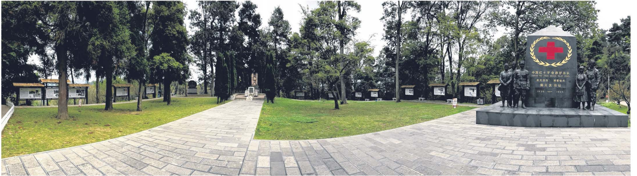
贵阳图云关中国红十字会救护总队纪念园全景。