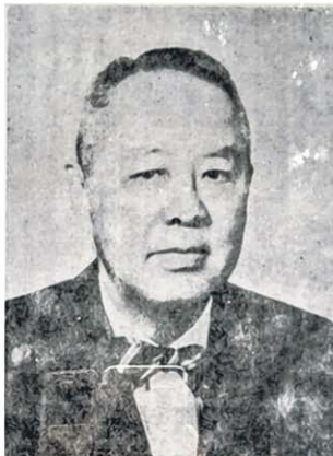
纪念园中的林可胜肖像。

在医学教育、军医实务和行政管理上，但他的医学研究成果也被学术界高度肯定。1942年他当选为美国国家科学院外籍院士，1948年当选中国学术界最高机构——中央研究院的第一届院士，而且他还是少数获得全票支持的当选者。1949年他移居美国并展开人生另一阶段的生活和事业。