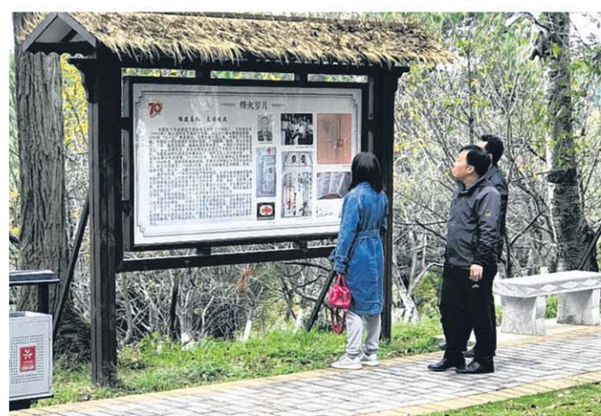
游客浏览有关林可胜的事迹。

林可胜在1952年后在美国印地安娜州的一个科学实验室从事医学研究工作，1967年不幸因癌症病逝于其长子居留的牙买加。